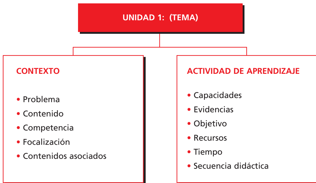
Fig. 1. Resumen esquemático de las Unidades.